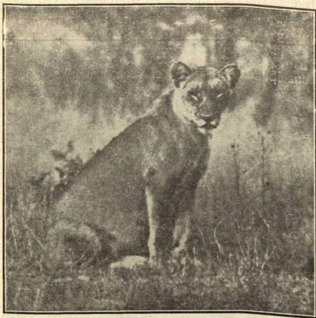
Tau e namagadi

fetseng, e sa tlhole e kgona go tshwara diphologolo, e boba gaufi le tsela, e go tsamayang batho teng; mme e tshware mongwe le mongwe yo o fetang, e mmolae.